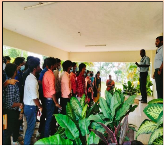
I B.Tech IT A & B students have been to Sakthi Soyas, Pollachi for an industrial visit & I Mechanical students made an industrial visit to Sakthi Dairy Division, Pollachi.