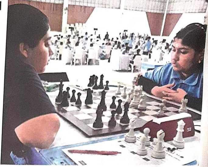
பொள்ளாச்சியில் 4வது நாளாக, தேசிய அளவிலான செஸ் போட்டி நடந்தது.

ஒவ்வொரு வீரரும் நிதா னமாக விளையாடி, தங்க ளுக்கான 'நகர்வு 'களை Carin செய்கின்றனர். இதனால், ஒவ்வொரு 'போர்டு' விளையாட்டும் விறுவிறுப்பாக நடக்கிறது.