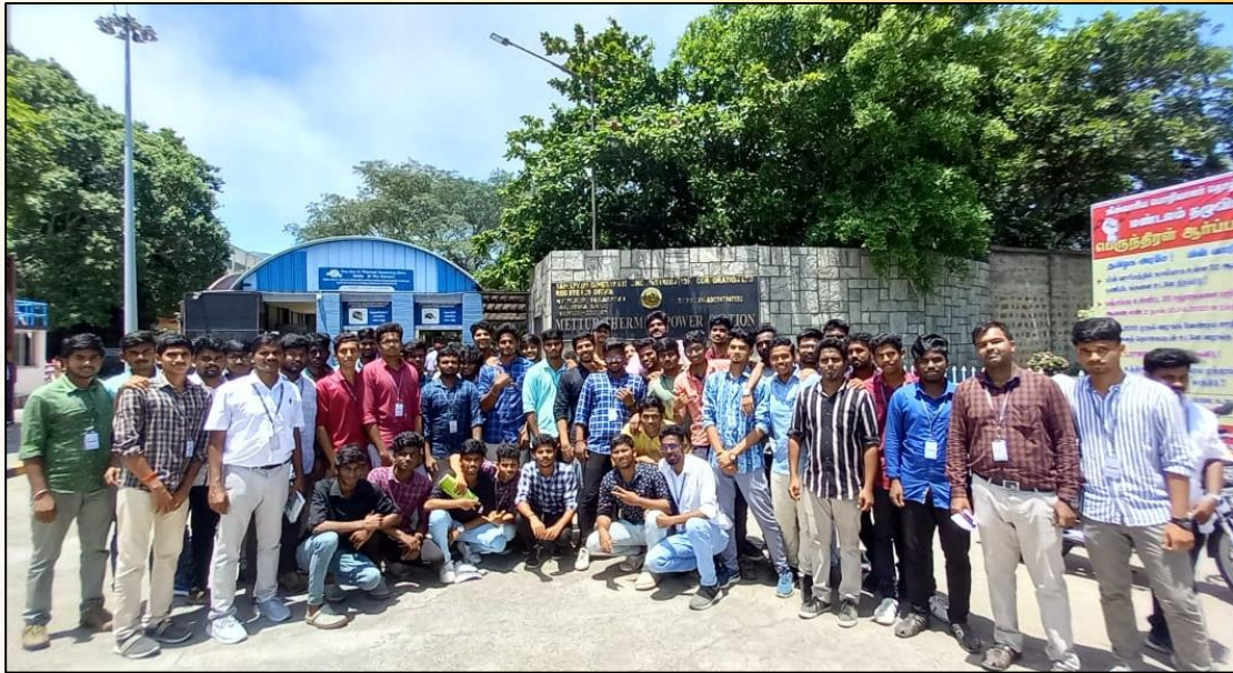
Third year Mechanical students along with two faculty members have undergone an Industrial Visit to Mettur Thermal Power Station.